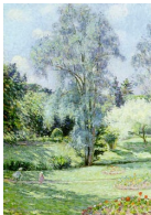
Henri Lebasque Enfant jouant au cerceau dans le jardin

est. 50,000 - 70,000 USD 237,500 USD © ↑ 239% est