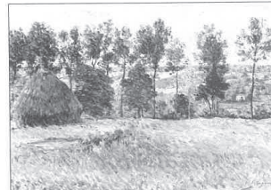
91.- PAYSAGE AVEC UNE MEULE

1900. Huile sur toile. 51,5 × 73 cm. Signée et datée en bas à gauche. Collection particulière. Provenance : Alex Maguy, Paris. Vente Christie's, Londres, 3 décembre 1971, n° 216 et 3 décembre 1974, n° 50.