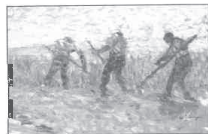
88.- LAGNY, LES MOISSONNEURS

Vers 1900. Huile sur toile. 55 × 45 cm. Signée et dédiée : « Avec mes meilleurs vœux » en bas à droite. Collection particulière.