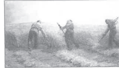
89.- LES MOISSONNEURS AUX ENVIRONS DE LAGNY

Vers 1899. Huile sur panneau de bois. 23,5 × 33 cm. Cachet d'atelier en bas à droite. Musée Gatién-Bonnet, Lagny-sur-Marne. Expositions : 1999-2000, Lagny, Musée Gatién-Bonnet, « Néo-impressionnistes – Le groupe de Lagny », 25 novembre-30 janvier. Itinérance : Musée du Petit-Palais, Genève, 1 er mars-14 mai. 2002, Le Cannel, Espace Bonnard, « Henri Lebasque, la lumière retrouvée », 1 er juin-1 er septembre, p. 6. 2002, Lagny, Hôtel de ville, « Henri Lebasque, un Post- impressionniste », 20 septembre-23 décembre, repr. cat. Bibliographie : 1999, Noël Coret, Autour des Néo- Impressionnistes, le groupe de Lagny , Editions Somogy, Paris, repr. p. 144.