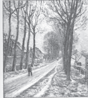
86.- LA PETITE ROUTE DE LAGNY À CHESY

Vers 1906. Huile sur toile. 61,5 × 51 cm. Signée en bas à droite. Collection particulière.