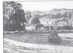
90.- LES CHAMPS PRÈS D'UN VILLAGE, LE MATIN

Vers 1899-1900. Huile sur toile. 95 × 150 cm. Signée en bas à droite. Collection particulière. Provenance : Vente Ketterer, Hambourg, 28 octobre 2006. Vente Sotheby's, New-York, 9 mai 2007, n° 249. Exposition : Il est possible qu'il s'agisse du n° 776 de l'exposition de la Société Nationale des Beaux-Arts de 1903 sous le titre LES FAUCHEURS.