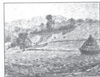
87.- PAYSAGE À LA MEULE

Vers 1906. Huile sur toile. 61,5 × 51 cm. Signée en bas à droite. Collection particulière.